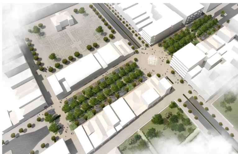
Η πρόταση ανάπλασης του κεντρικού τμήματος της Παλαιολόγου